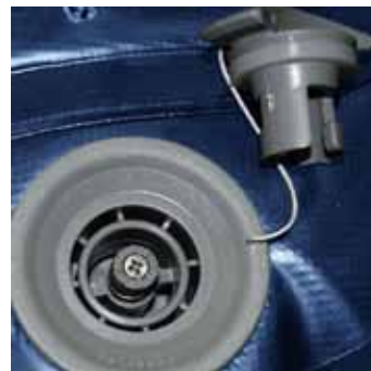
スプリング作動バルブ