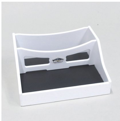
●ストレージトレイボックスBL-4 ¥15,950 ベースサイズ：290×254×高さ125mm