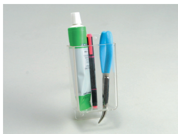
●クリアポケット ¥2,420 サイズ：72×58×高さ120mm アクリル製の多目的ホルダーで携帯TEL・ポータブルVHF・サングラスなどを収納するのに便利です。両面テープ又は小ビスでセットしてください。