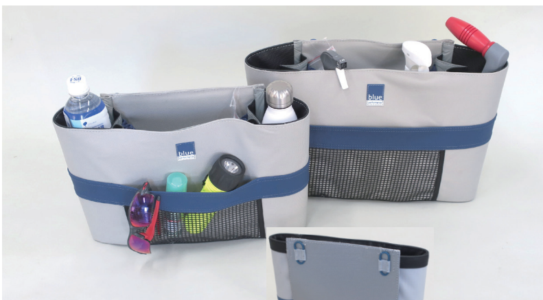
Blue ●コンビバック S ¥14,410 M ¥15,840 サイズ S：W350×H200×D100mm サイズ M：W385×H275×D110mm 耐候性の良いキャンパス製で、両サイドにペットボトル等を入れることができる縦長のポケットが付き、中央部には大きく空いたスペースを有した壁付用のコンビバックです。取り付けは付属のPLフックを4ヶ所付けることで簡単に脱着可能なタイプですので長持ちします。