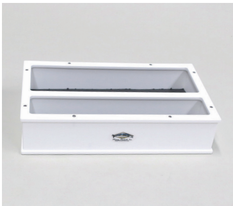
●ストレージトレイボックスBL-6 ¥17,600 ベースサイズ：360×208×高さ80mm