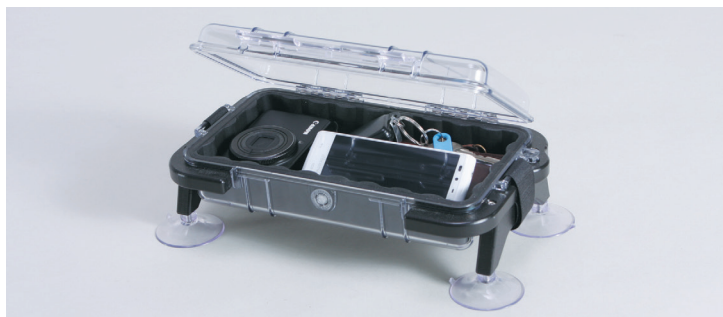
●ストレージボックスP-1060 ¥17,600 PELICAN1060ボックスを利用して製作した衝撃と防水性に富んだストレージボックスです。外形サイズ：260×150×高さ100mm（サクシオンを含む）