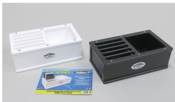
●ストレージボックスCPS ¥13,860 カラー：ホワイト、ブラック ベースサイズ：246×141×高さ80mm