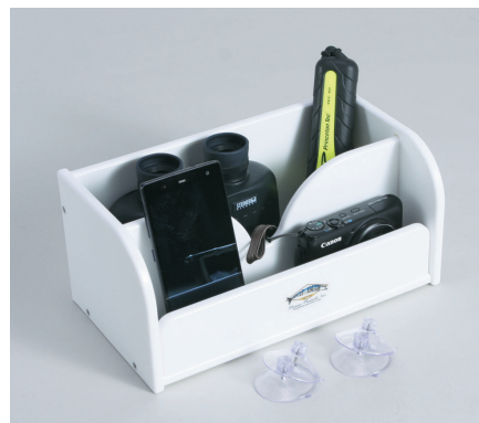
●ツールホルダー BL-2 ¥13,200 双眼鏡、サングラス、携帯電話等を収納するツールホルダーです。底にはネオプレンの海绵が付いています。キングスターボード製（サクシオン4個付）。ベースサイズ：275×150×高さ126mm