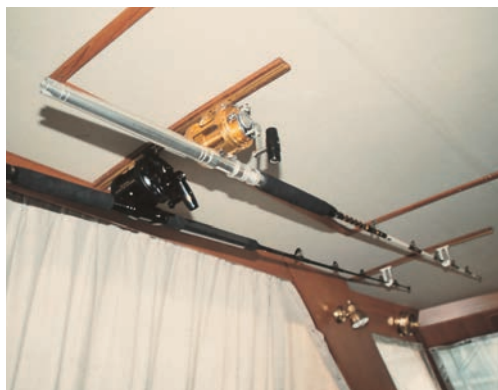
※写真は、PENN50ポンドとSHIMANO50ポンドのリール&ロッドをセッティングした例です。①②を各1本、③を2セット使用。