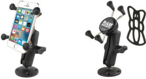
●スマートフォンマウント RAM-B-138-UN7 ベースサイズ：直径62mm、ボール径25mm、ホールド最大幅：82mm、厚さ22mm、重量：0.34kg