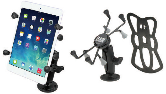
●7インチタブレット RAM-B-138-UN8 ベースサイズ：直径62mm、ボール径25mm、ホールド最大幅：146mm、厚さ22mm、重量：0.40kg