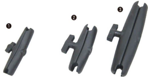
●ロングダブルソケット ①RAM-B-201-C 長さ152mm、ボール径25mm ②RAM-201 長さ142mm、ボール径38mm ③RAM-201-D 長さ232mm、ボール径38mm