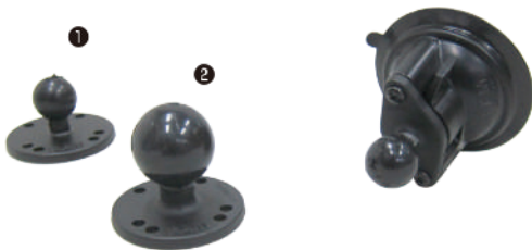
●ラウンドプレート ①RAM-B-202 ベース径62mm、ボール径25mm ②RAM-202 ベース径62mm、ボール径38mm ●サクシオンキャップベース RAM-B-224-1 ロックノブを回転させる事により強力に吸盤が固定されます。 サクシオンベース径：85mm、ボール径25mm