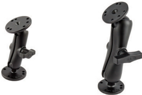
●ラウンドベースマウントRAM-B-101 上下ベースサイズ：直径62mm、総高さ130mm、ボール径25mm