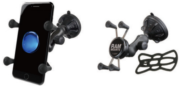
●スマートフォンサクシオンマウント RAP-B-166-2-UN7 サクシオンベース径：85mm、ホールド最大幅：82mm、厚さ22mm、重量：0.30kg、ボール径25mm