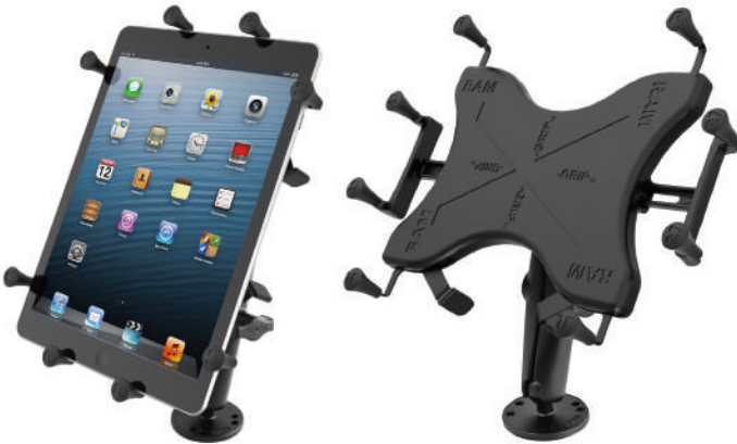
●10インチタブレット RAM-B-101-C-UN9U ベースサイズ：直径62mm、ボール径25mm、ホールド幅：158～206mm、厚さ22mm、ホールド高さ最大：260mm、重量：0.40kg、ボール径25mm